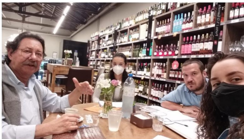
FOTO 4 – REUNIÃO COM O SECRETÁRIO DE MEIO AMBIENTE E EQUIPE DE REVISÃO DA APA EMBÚ VERDE